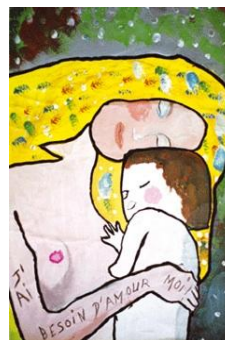
Détail des « 3 âges de la vie » de Klimt (1905) revisité par le Centre de loisirs Majorque de Perpignan (66) en 2005.