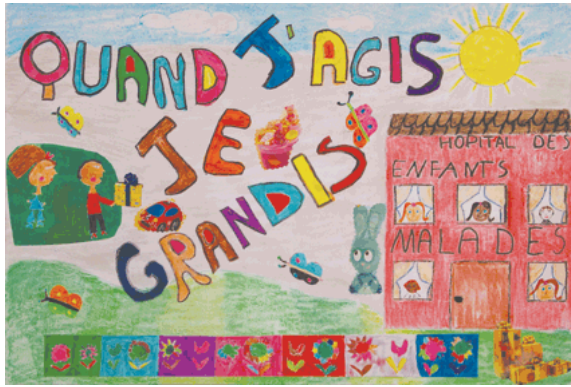
"Quand j'agis, je grandis" Centre de loisirs maternel Bois Perrier (Rosny sous Bois – 93)